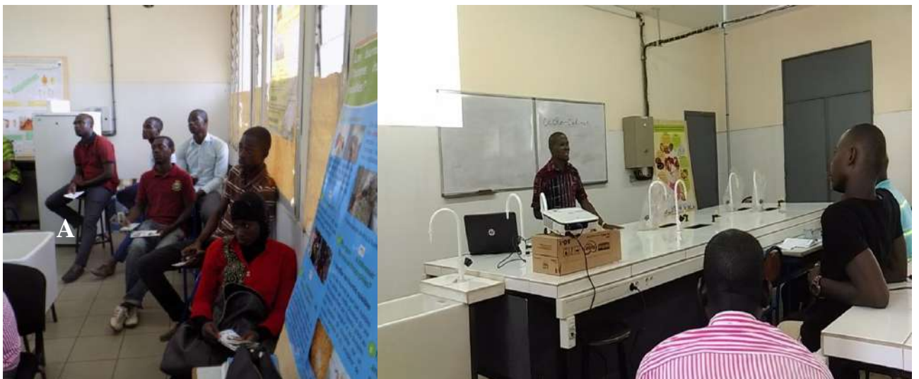
Photo 2: Séance de présentation de l'exposé sur les espèces exotiques et envahissantes à l'université Nangui Abrogoua

Le matériel utilisé au cours de cette sensibilisation était constitué d'une présentation ayant pour thème : « les espèces exotiques envahissantes : un fléau environnemental », deux types de posters, l'un intitulé « La fourmi de feu tropicale Solenopsis geminata : une fourmi exotique invasive nouvelle pour la Côte d'Ivoire, un cas de biosécurité » et un autre intitulé « Les fourmis vivant avec l'homme : inoffensives ou nuisibles ? » (Photo 2) et deux type de prospectus. Le message consistait d'une part à éclairer les uns et les autres sur certains termes relatifs aux espèces exotiques et envahissantes, les conséquences liées à ces espèces, les voies d'introduction possibles de ces espèces et les actions à mener pour limiter leur effet délétère sur la biodiversité. Un contenu détaillé de la présentation a été fourni dans les documents attachés à ce rapport. D'autre part, les résultats de nos recherches ont été présentés en faisant un focus sur la fourmi exotique envahissante de feu tropical Solenopsis geminata , découverte pour la première fois en Côte d'Ivoire. Au cours de cette séance de sensibilisation, nous avons constaté que malgré les connaissances des participants sur la biodiversité, ils avaient très peu d'arguments sur le sujet des espèces exotiques et envahissantes. Cette sensibilisation a donc été un événement important dans le sens où il a permis d'éclaircir de nombreux point d'ombre sur l'introduction des espèces exotiques et envahissantes.