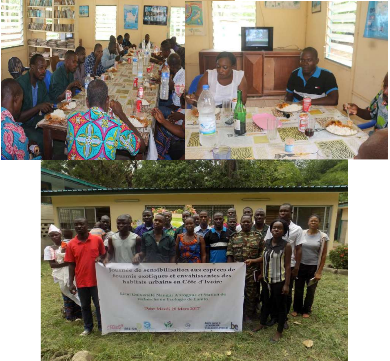
Photo 7: Collation après la séance de sensibilisation et photo de groupe avec les participants.

La clôture de la journée de sensibilisation s'est faite par une prise de photo de groupe avec tous les invités. Nous avons ensuite été partagés un repas comme prévu dans les activités de cette journée (Photo 7 et 8). De même, à la fin de la collation, nous avons remis des posters de la fourmi exotique envahissante découverte pour la première fois en Côte d'Ivoire à chaque représentant des différentes couches venues assister à la sensibilisation.