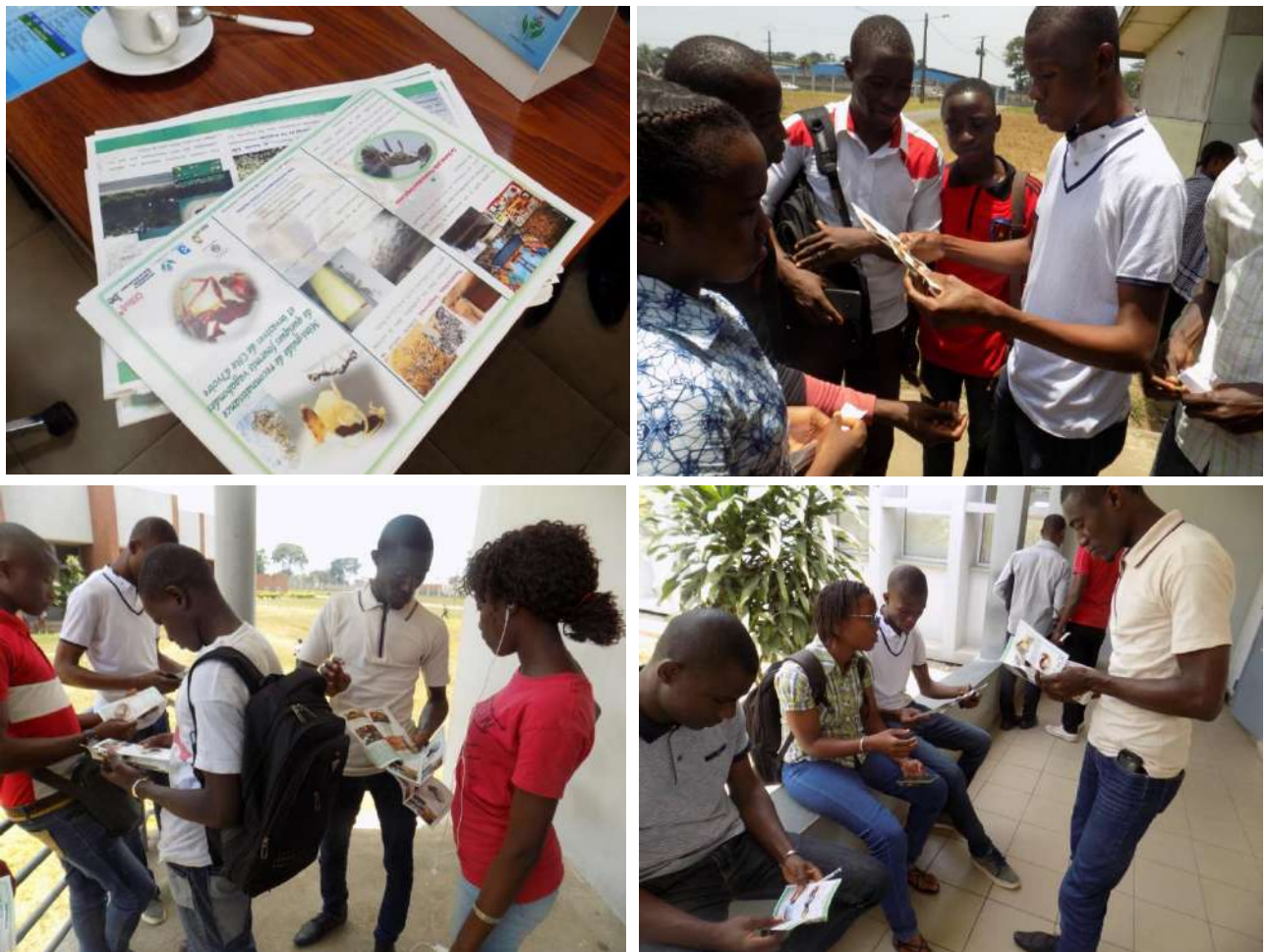
Photo 2: Distribution et explication des prospectus aux étudiants au sein du campus de l'université Nangui Abrogoua pendant la journée de sensibilisation

Dans cette partie, l'objectif a été d'attirer l'attention du public cible sur les fourmis exotiques envahissantes vivant dans le voisinage immédiat de l'homme et d'expliquer comment ces espèces peuvent être une menace pour la santé, l'économie et l'environnement. Les dépliants ont ainsi été distribués avec une courte séance d'explication (Photo 3).