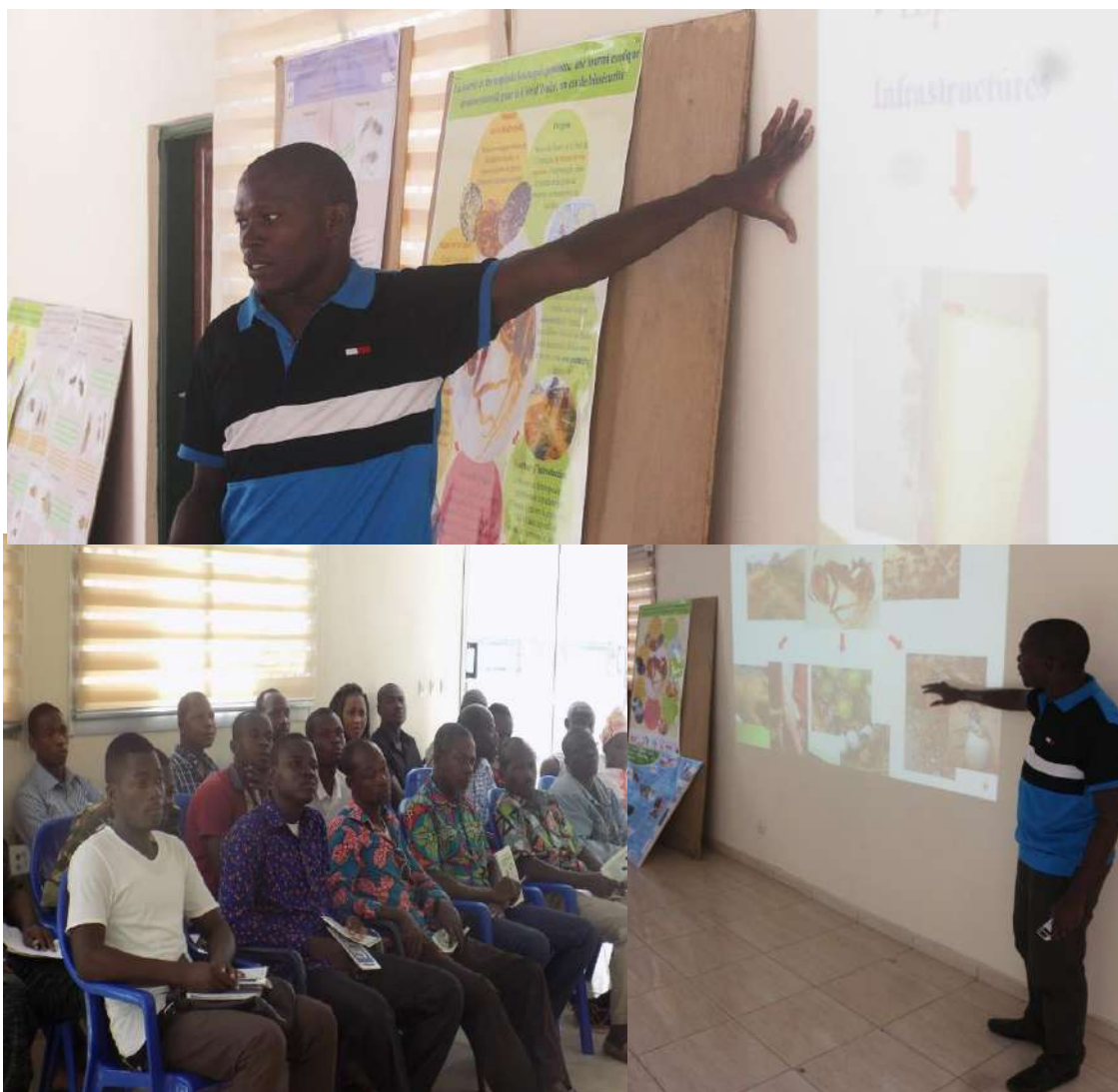
Photo 6 : Présentation des résultats de notre recherche aux représentants de l'OIPR et des communautés villageoises au cours de la journée de sensibilisation.

Nous avons par la suite expliqué le contenu des deux types de dépliants qui indiquent surtout les espèces exotiques envahissantes de fourmis identifiées au cours de nos travaux et qui vivent au voisinage immédiat de l'homme.