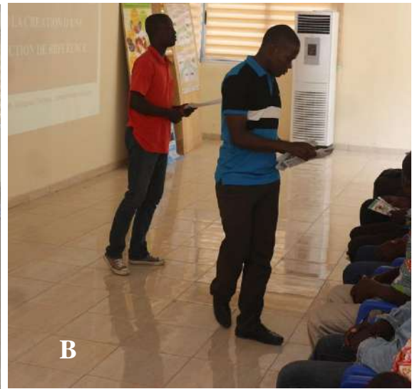
Photo 5: A -Intervention du directeur de la Station de Lamto avant la présentation; B -Distribution des prospectus et dépliants aux participants.