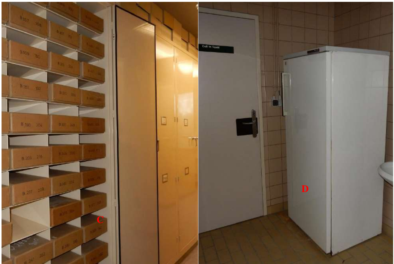
C : étagère de rangement des cartons contenant des spécimens ; D : congélateur de conservation des spécimens de grandes tailles