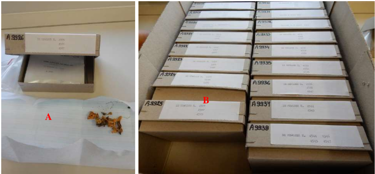
A : Echantillon rangé dans une petite boîte ; B : Boîtes rangées dans un carton