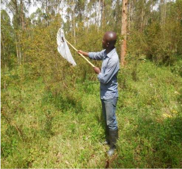
Méthode du Filet entomologique