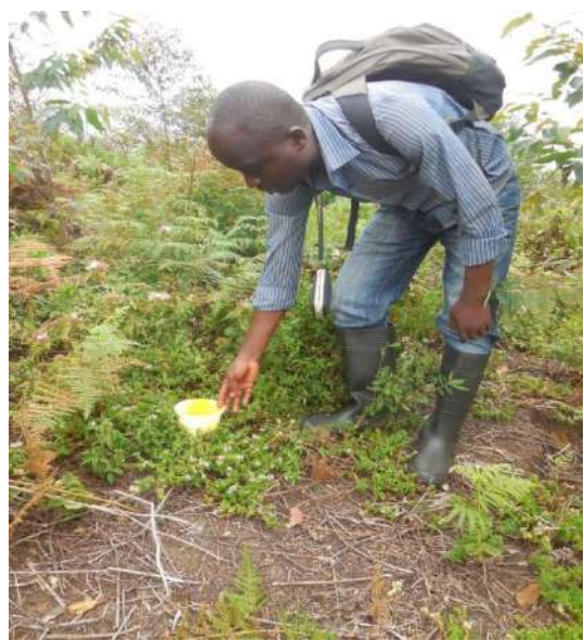
Méthode des bacs jaunes