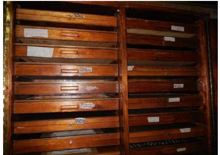
Collection du Burundi